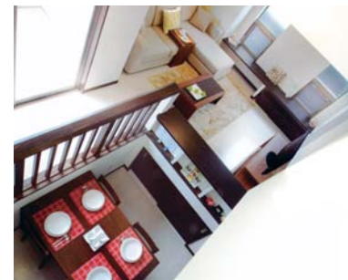
1|採光の極意 ※イメージ写真です。 室内にいきなり光を振り込む…採光は家づくりにおいても重要な要素です。ただ単に窓を数多く設置することが答えではありません。建物の立地状況や自然の原理、ガラスの特性も踏まえ、「ナナメウエ」が生み出す効果的な採光をプランニングします。