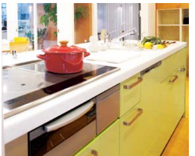
3|信頼できる設備 ※イメージ写真です。 キッチン・バス・トイレの水まわりについても「ナナメウエ」志向にこだわっています。空間のゆとり・開放感・効率を踏まえて設備を配置することを前提に、暮らしの質を上げる機能・デザインを提案致します。