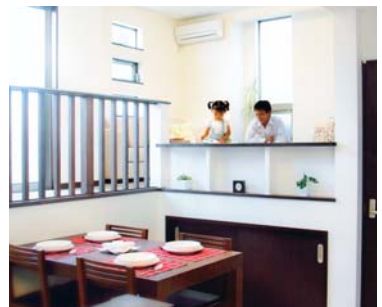
2|幸せな風景 ※イメージ写真です。 室内に風の通り道をつくる設計はもちろん、「ナナメウエ」に焦点を当てて、限られた空間の中にも開放感あふれる広がりを生み出し、家族とのコミュニケーションを深めるシーンを演出するなど、付加価値の豊富な暮らしをプランニングします。